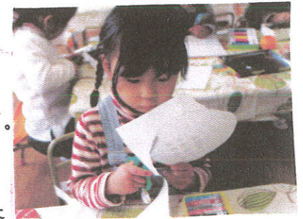
ハサミの使い方も上達し、○や△を切るのに挑戦できるようになりました。