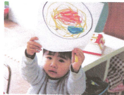
何味のふりかけがいいかな~